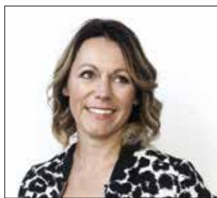
Ex-toptennisser en performance coach Sabine Appelmans:

Ons Zorgnetwerk gaat samen met Ferm in 2021 voluit voor de 'Appelbappel', een momentje van verbinding. Een moment van tijd voor jezelf want een appelbappel zet de tijd een paar minuten stil. Letterlijk even een appeltje de tijd nemen voor jezelf en voor de ander. Een welgekomen moment voor elke mantelzorger, nog meer dan ooit nodig in deze bizarre zorgperiode: even de nodige rust in je hoofd en een extra portie energie bijtanken.