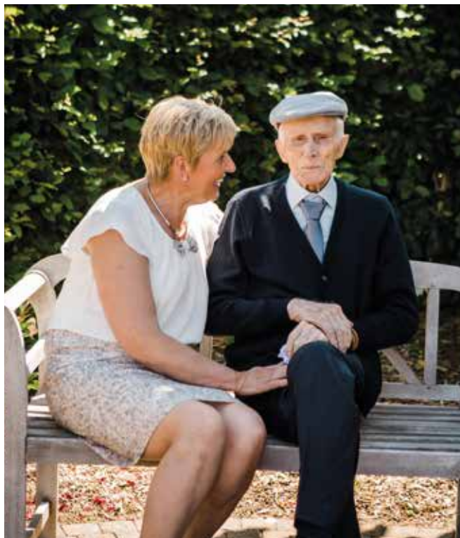
Gerda met pa.

leefruimtes voor onze beide gezinnen. Die privacy was voor mij erg belangrijk.